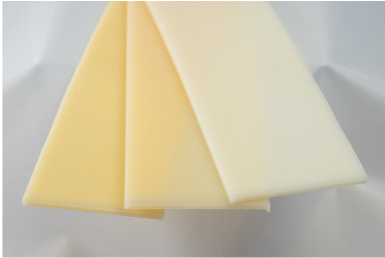
Farbunterschiede: von weisslich über gelblich bis bräunlich